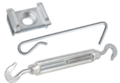
Alu-Auflageböcke, Distanzhalter (Typ 120) und Schraubspanner (Typ 140) sorgen für eine hohe Stabilität.