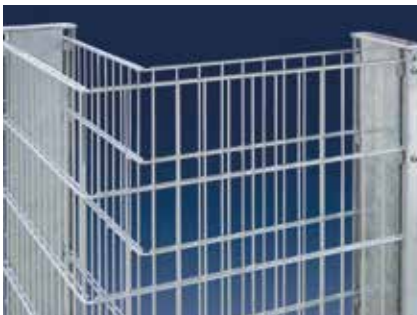
Ecklösung im 90°-Winkel

Stabilität erhält die RANKO Steinmauer durch die feuerverzinkten Doppelstabmatten vom Typ 8/6/8 sowie durch Profilrohrpfähle mit beidseitigen Profilschienen und Alu-Auflageböcken, die vor der Montage einbetoniert werden. Ein „Ausbauchen“ wird durch den Einsatz von Schraubspannern vermieden, die als Zubehör erhältlich sind.